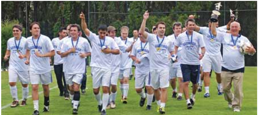
Campinas conquista troféu de ouro