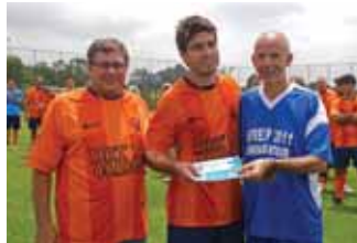
Melhor jogador da partida