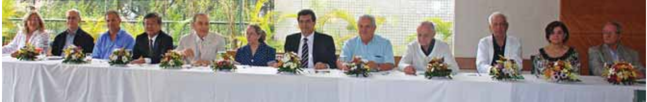
Thereka (ao centro), diretoria, conselho e colegas da Afresp

Desde a década de 80, Associação das Pensionistas é parceira da Afresp