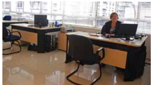
Atendimento de Seguros também é realizado no Escritório Centro

É importante lembrar que o atendimento do departamento de Seguros é estendido ao escritório centro, localizado próximo a Sefaz, e em todas as 18 Regionais que contam com colaboradores aptos para realizar os atendimentos.