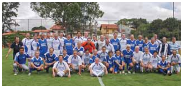
Veteranos do interior (camisa branca) e da capital (camisa azul)

O grupo combinado do Interior venceu por 4 a 0 o grupo combinado da Grande São Paulo. No total, 40 jogadores compuseram as duas equipes e mostraram muita disposição e alegria. "Os futebolistas do passado sentiram-se honrados por serem convidados para esse jogo amistoso", disse o coordenador de Esportes da Afresp , professor Paulo de Carvalho.