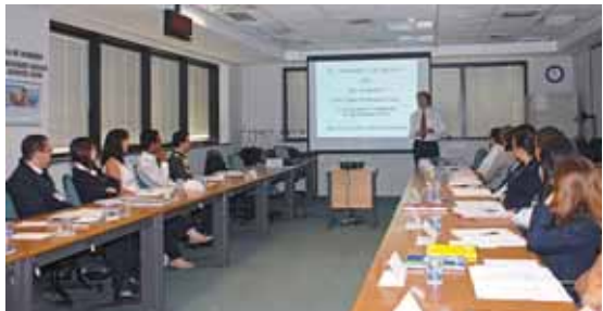
Colaboradores da Afresp durante treinamento 5S

A primeira etapa do chamado "dia D" - dia de fazer a limpeza e organizar o ambiente de trabalho, foi realizado na Afresp no dia 3 de dezembro, um sábado. "Este foi o primeiro passo para tornarmos nosso ambiente de trabalho mais agradável. Vamos criar as comissões