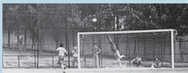
Foto tirada em um dos primeiros campeonatos de futebol da Afresp