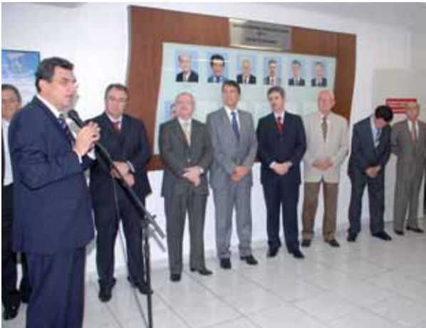
Ex-delegados da DRT-12 homenageados durante solenidade

Com apoio da Afresp, o evento homenageou todos os ex-delegados da DRT do ABCD