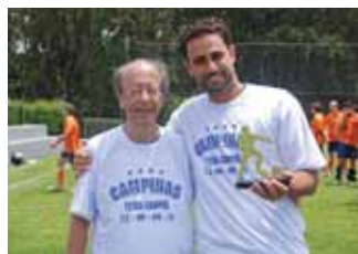
Artilheiro do campeonato