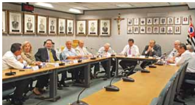
Reunião realizada no dia 30 de novembro

Ele também ressaltou que todos os membros Fundafresp tiveram a preocupação de beneficiar um número maior de pessoas nessa época do ano. "A caridade faz nosso Natal muito melhor", afirmou.