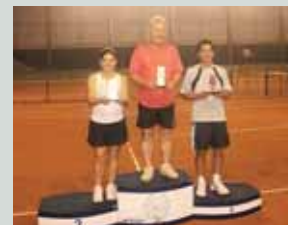
Vencedores da categoria (B)